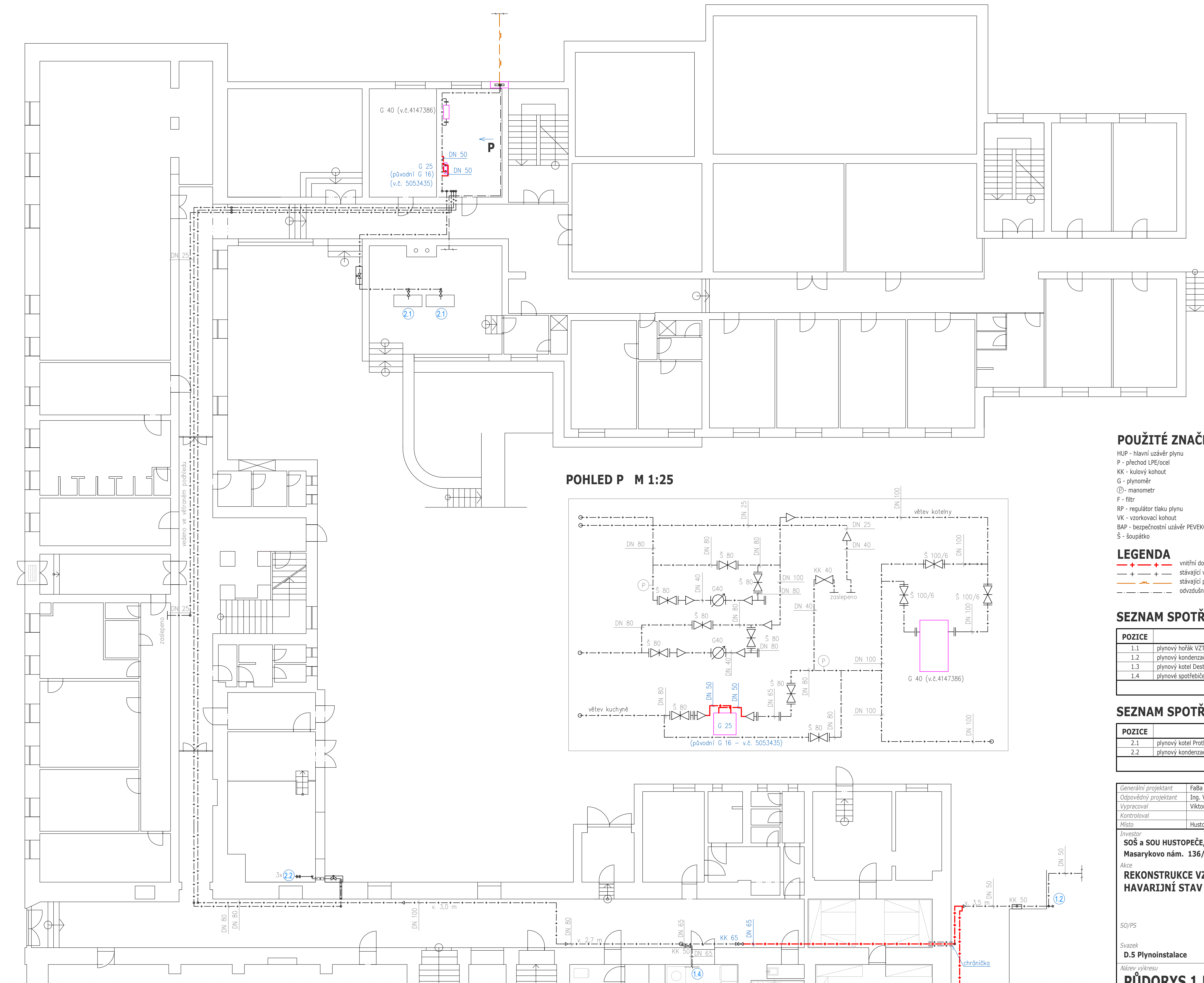
POHLED P M 1:25